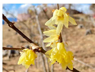
咲き始めたロウバイ