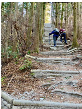
長い、長〜い、丸太の急登