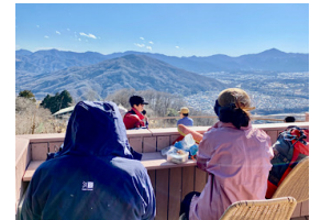
山頂テラスからの展望