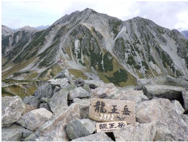
龍王岳から雄山を望む