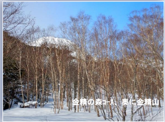
金精の森コース、奥に金精山