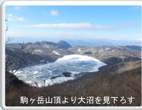
駒ヶ岳山頂より大沼を見下ろす

感想： 駐車台数 100 台の県立赤城公園おのこ駐車場は満車だったが運よく 1 台のみ空いていた。アイゼンをつけて出発。連アイゼンを小気味よく効か頂に到着した。すぐ5-6分人位の登山者が休んでいの積雪。真っ白な谷川岳連いったん大タルミまでからは結氷し氷上ワカサ下ろす。大沼へ下る登山道た。