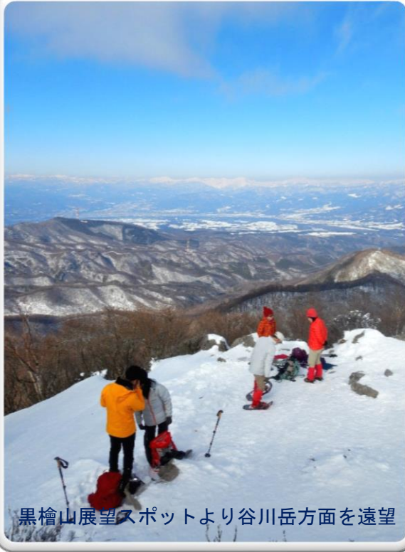
黒檜山展望スポットより谷川岳方面を遠望