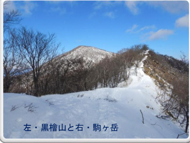
左・黒檜山と右・駒ヶ岳