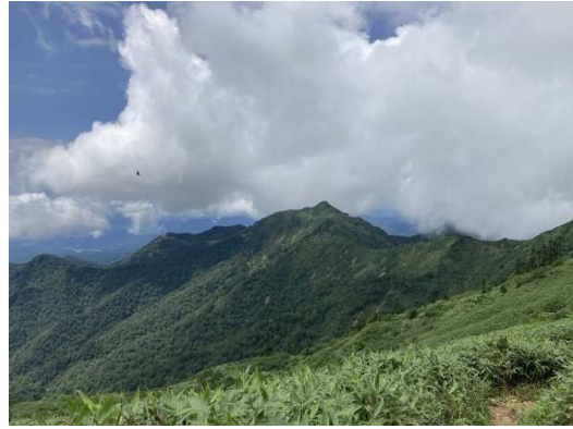
No2 中ノ岳付近から剣ヶ峰方面