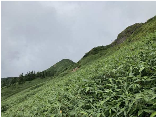
No1 中ノ岳付近から武尊山方面