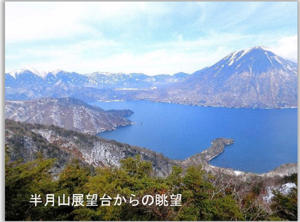
半月山展望台からの眺望