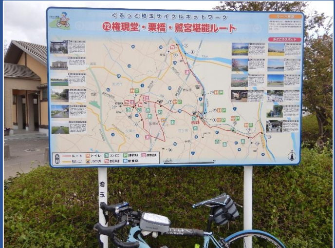
ぐるっと埼玉ルート図(権現堂前)