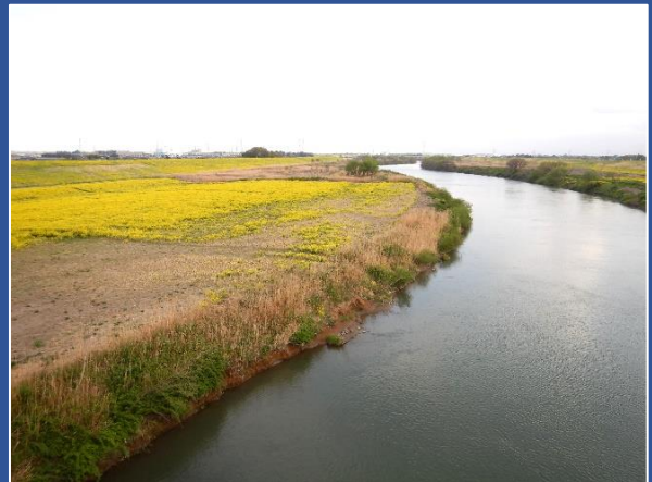
関宿橋より江戸川下流方面を望む