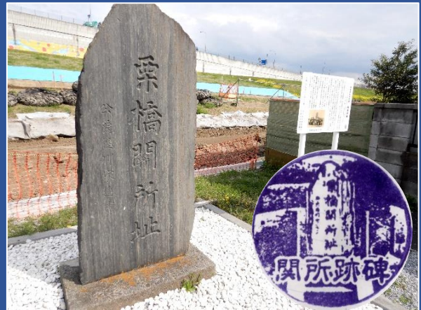
栗橋関所跡(同所備付のスタンプ↑)