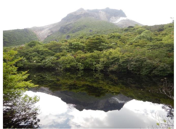
ひょうたん池に映る、噴煙を上げる茶臼岳