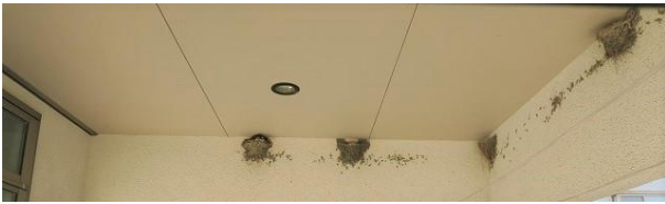
2018年9月外装のため車庫上の4つの巣取り払う