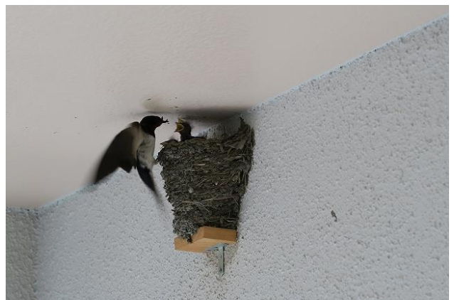
親ツバメ給餌で忙しい