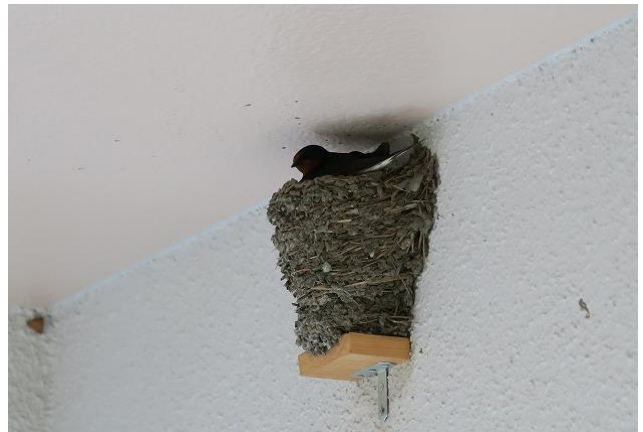
2020年6月28日から巣を修復し・産卵・抱卵