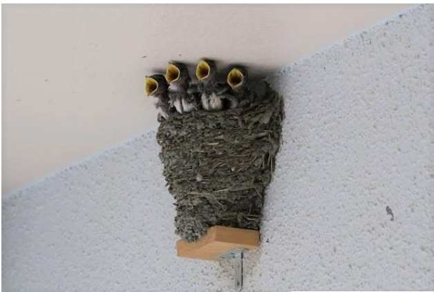
4羽大きく育ち食欲旺盛 7月31日早朝撮影