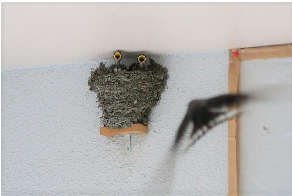
2羽になってしまった

4本の赤ビニール紐はカラス除けである。以前カラスに襲われたことがあった。30cm間隔で縦横4本。カラスは小回りできないため近寄らず。