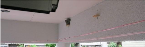
2019年から1つ巣ができて子育てする