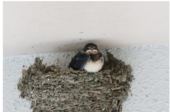
8月4日 早朝巣立ちした

8月1日午前 巣に雛の姿が見えず、2羽とも犠牲になったとあきらめていたが、親ツバメが何回か出入りしているうちに頭が見え、1羽元気なことが確認された。「よかたー」早速、巣の周辺にゴミ袋を貼り付ける。2日・3日は何事もなく経過し4日早朝巣立ちし安心した。