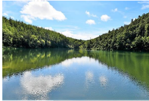
← 双子池・雌池 ↓ クロジ