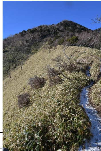
赤薙山・うっすらと雪で白い登山道