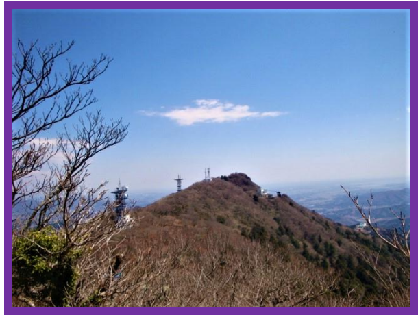
男体山より女体山を望む