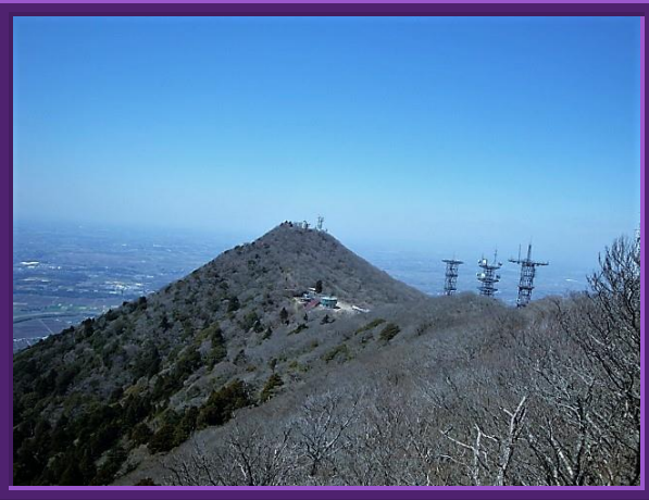
女体山より男体山を望む