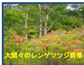
大間々のレンゲツツジ群落

小間々の駐車場に駐車するつもりだったが通り過ぎてしまい、林道終点の大間々駐車場でとめた。公衆トイレがありこちらで正解だった。見晴コースをたどり八海山神社あたりで開けた尾根に出たが、曇り空で見晴らしは良くない。分岐を過ぎにゴヨウツツジ(シロヤシオ)の普通のより大きい。下山は大入道峰に着く。気温11度C。剣ヶ峰ない。大入道には三等三角点あり。