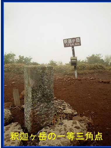
釈迦ヶ岳の一等三角点