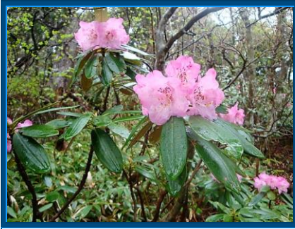
アズマシャクナゲ