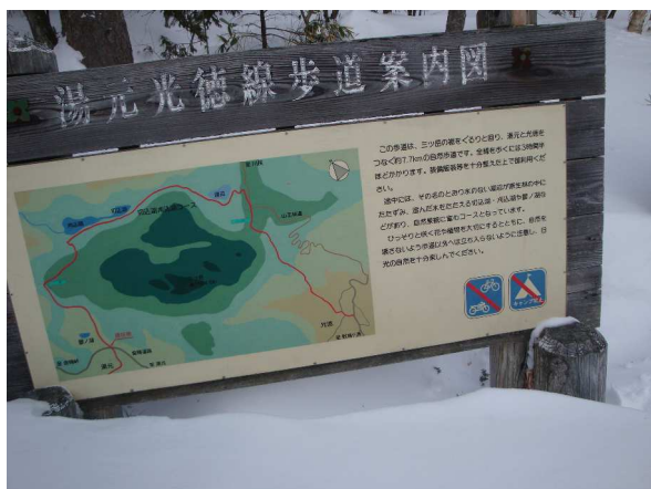
赤線のように湯元から光徳へ行く予定だった。